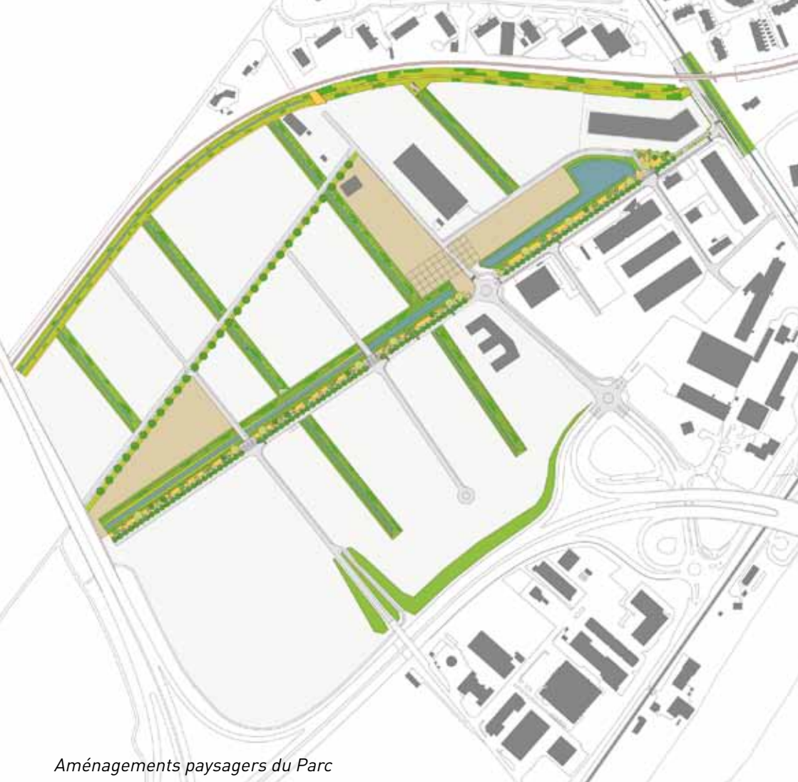
Aménagements paysagers du Parc