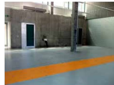
Salle de production de Suisselle

Je pense que la Suisse est très attractive pour tous les pays et non pas uniquement pour la Russie. C'est un pays organisé, où apparemment tout fonctionne. Une multitude d'événements et d'actions sont entrepris en Suisse comme en Russie pour faciliter les contacts, telles que conférences, présentations, réseautage, etc. Le Canton, via le DEV, nous a beaucoup aidés dans notre implantation. Un autre point important et décisif: le label Swiss Made, un réel atout!