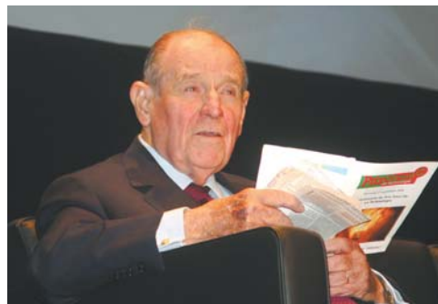
«L'économie mondiale est-elle menacée par une pénurie énergétique? Je ne crois pas», a expliqué l'ancien professeur d'économie.