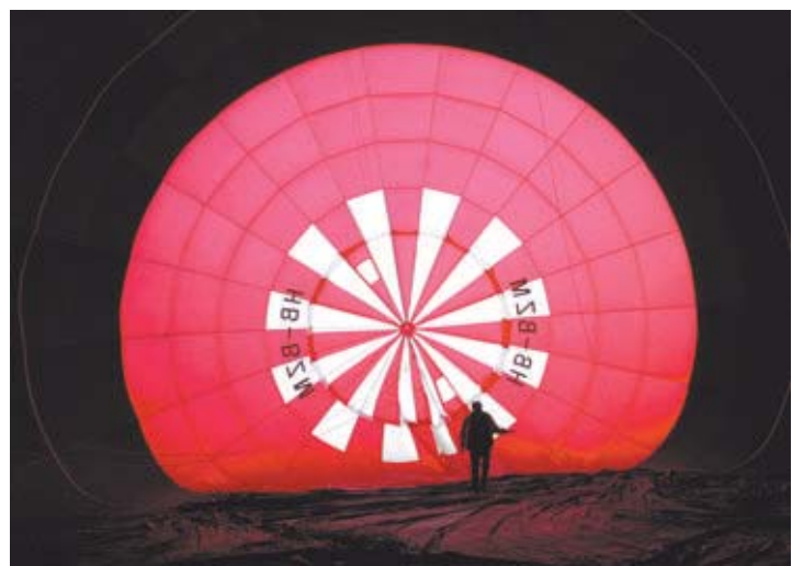
Dans la lumière du petit matin, la préparation des montgolfières a donné lieu à des scènes parfois étonnantes.