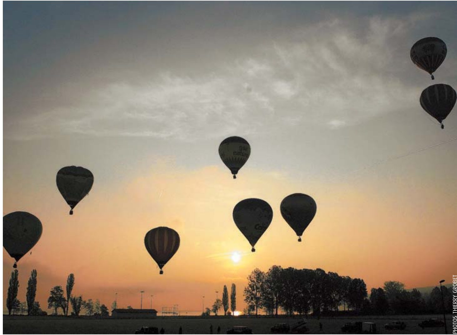
Parties groupées des rives du lac, les huit montgolfières n'ont pas tardé à se répandre dans le ciel, diffusant chacune une «voix» d'un ensemble musical spécialement étudié pour recréer une harmonie pour l'auditeur. Un réveil en douceur ou des rêves éveillés.